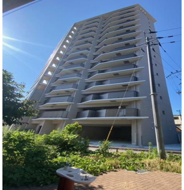
おしゃれでスタイリッシュな外観